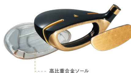
高比重合金ソール

すべては飛ばすために、GIIIは妥協しない。ユーティリティも高反発。低・深重心化したW反発ヘッドに「DAIWAのカーボンテクノロジー」を結集したGIII史上最軽量シャフトを装着。