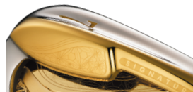
独自のソール形状

すわりが良く、構えやすく、キレがいい、独自のGIIIネオツインカットソールを採用し、スイング時における地面からの抵抗を大きく削減。幅広ソールでも振り抜きやすさを実現し、キレのあるアイアンショットでピンを狙えます。