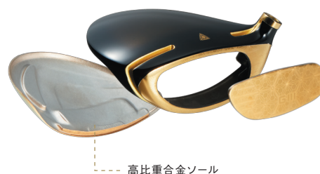
高比重合金ソール